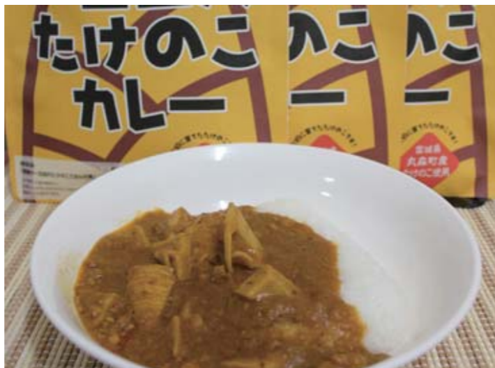
感動の一日四尺たけのこカレー

☆皆様からのイベント情報等をお待ちしています。原稿は毎月二十日頃までに、当店へ直接お持ちいただくか、FAXまたはメールにてお送り下さい。