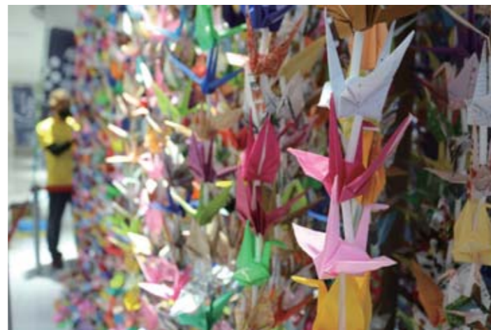
かくだ田園ホールに展示された折り鶴

々が広がる南国風の光景を写真に収めたかったのですが、厚い雨雲が去る気配はなく、記事化も含めて今回は断念しました。収穫は10月ごろの見込みです。東北の気候でパイアを完熟させるのは不可能なため、熟す前の青パイアまで育てます。野菜感覚で食べられるそうです。栽培主の方は多くの人に味わってもらおう方法をいろいろと練っています。近いうちにパイアの続報を届けられるのではないのでしょうか。夏が過ぎても、市民の熱意あふれる取り組みから目が離せません。