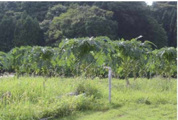
小坂地区のパパイア畑