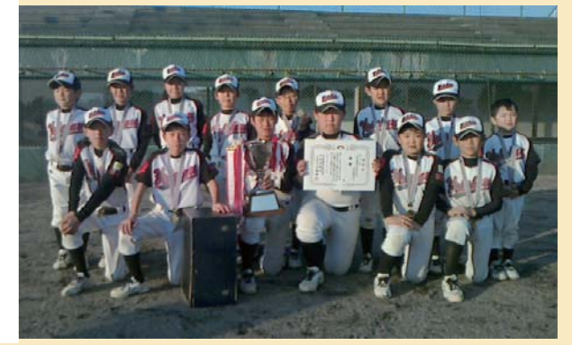
優勝した横倉少年野球クラブ