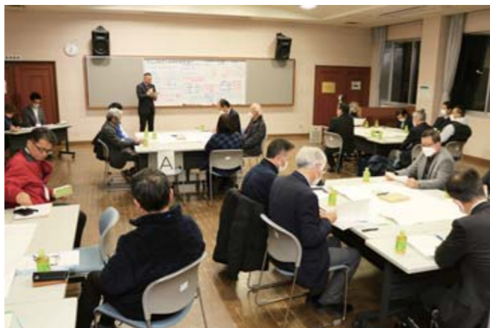
第3回市阿武隈急行利用促進協議会 (角田自治センター)

旧国鉄丸森線の開通や1988年の全線開通を地域一丸で実現したものの、その熱意と裏腹に利用実態は低調でした。同じ轍を踏むことは許されません。10年、20年後を生きる次世代のために、安心のレールを敷設することが求められています。