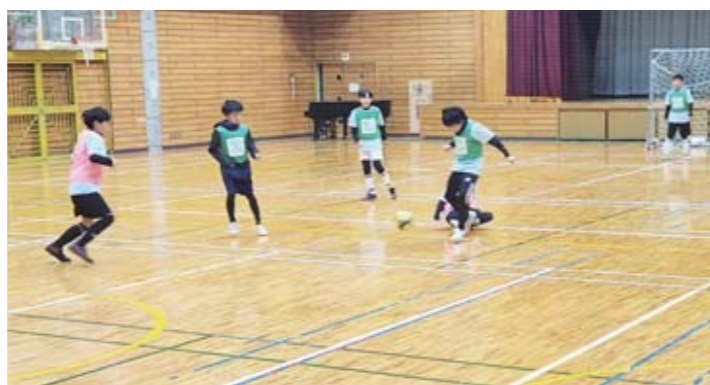
サッカーの練習に取り組むよこくらFCの子どもたち

Kスポのような運動施設が集約されたスポットは決して多くありません。スポーツ大会などのさらなる誘致、または合宿地としての活用も考えられます。地域がスポーツで活気づいていくことで、子どもたちがやりたいスポーツや活動を選べる環境を守ることができるといいですね。