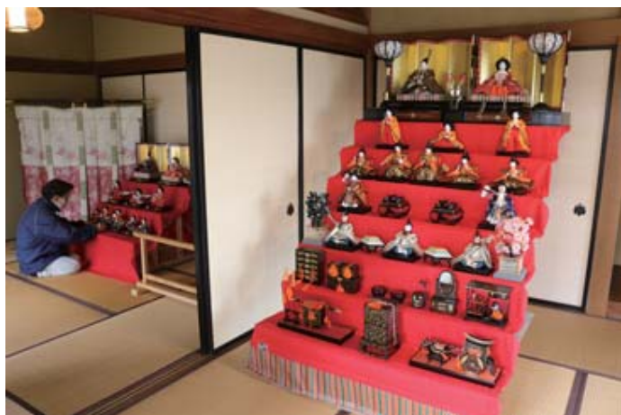
資料館で昨年開かれたひな人形の企画展

☆皆様からのイベント情報等をお待ちしています。原稿は毎月二十日頃までに、当店へ直接お持ちいただくか、FAXまたはメールにてお送り下さい。