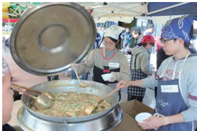
道の駅かくだで11月にあった復興イベント。芋煮が振る舞われた