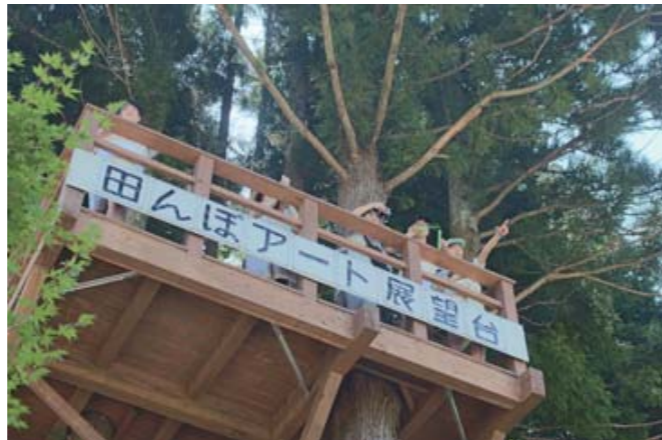
8月、田んぼアートの展望台から作品を眺める見物客