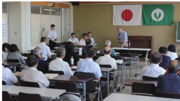
8月7日に開かれた角田市議選の立候補予定者説明会