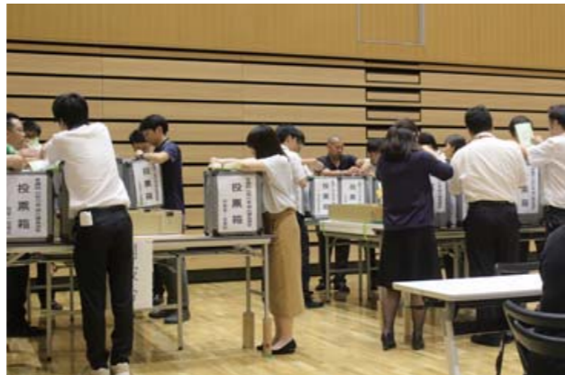
7月21日の参院選で、角田市内分の投票箱を開ける市職員

投票箱に詰まった用紙の量が、市民の地元に対する愛情の量だとすれば、投票率の落ち込みには寂しさが募ります。立候補者の数次第で選挙戦になるかどうかの問題もありますが、市議選や県議選では、角田へのラブレターを書こうと多くの市民が投票所へ向かうことを期待しています。