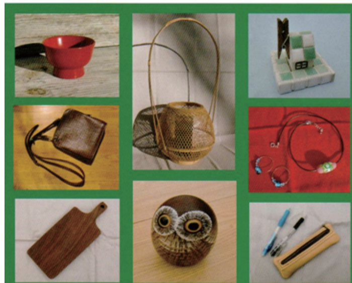
注 上記の作品は過去3回の参加作家一部の作品です。

開催場所 柴田町船岡城址公園 6月3日(土) 4日(日) (雨天決行) 時間 午前9時30分～午後4時 4日は午後3時迄