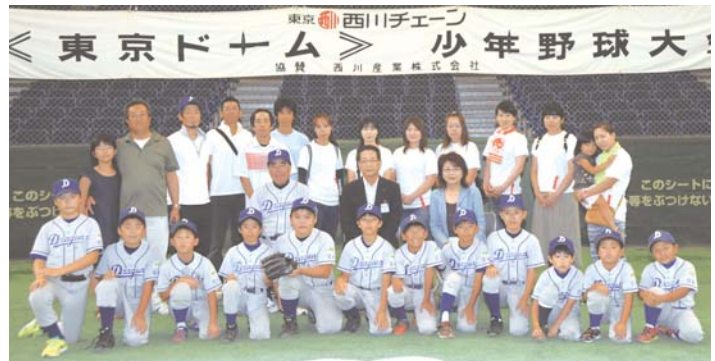
西川主催、東京ドーム少年野球大会出場